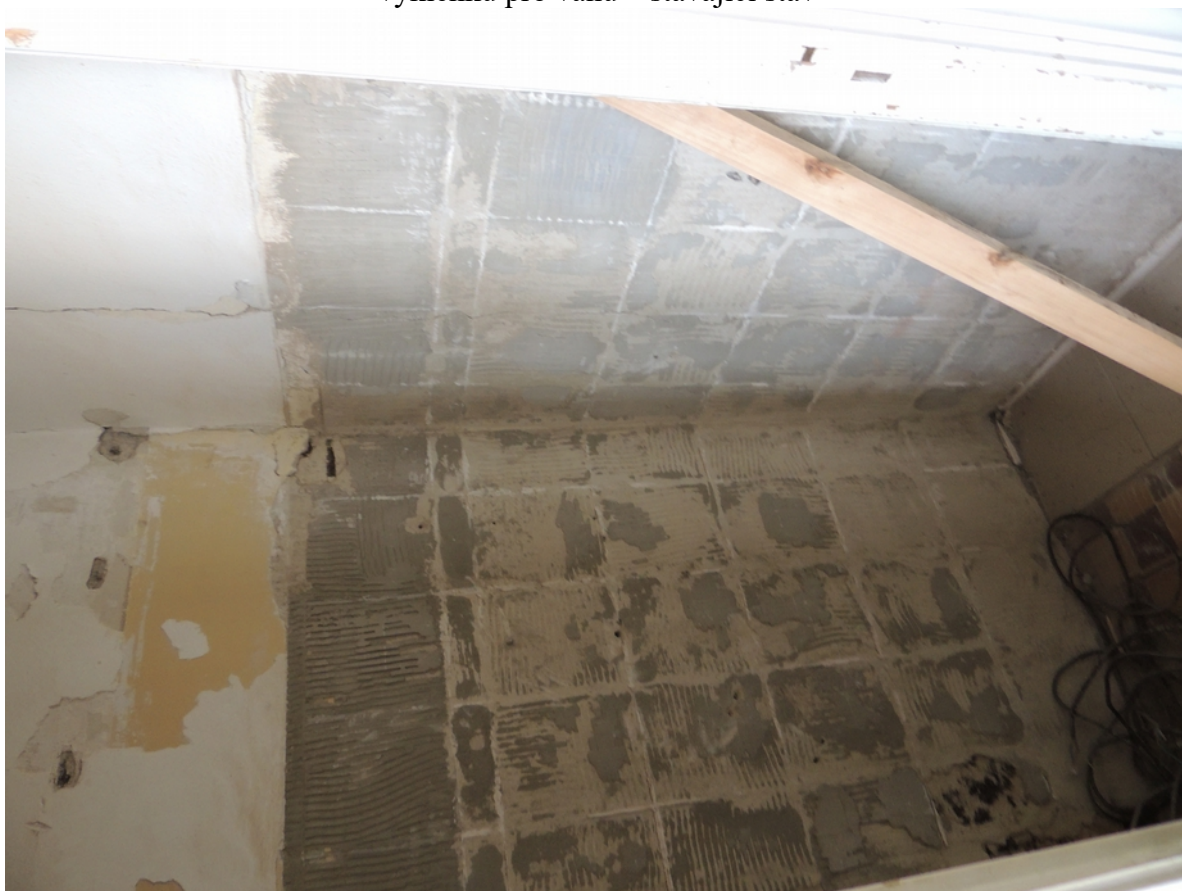
Panenské Břežany, horní zámek, koupelna v 1. patře, detail poškození omítek a sejmutých obkladů v prostoru toalety – stávající stav