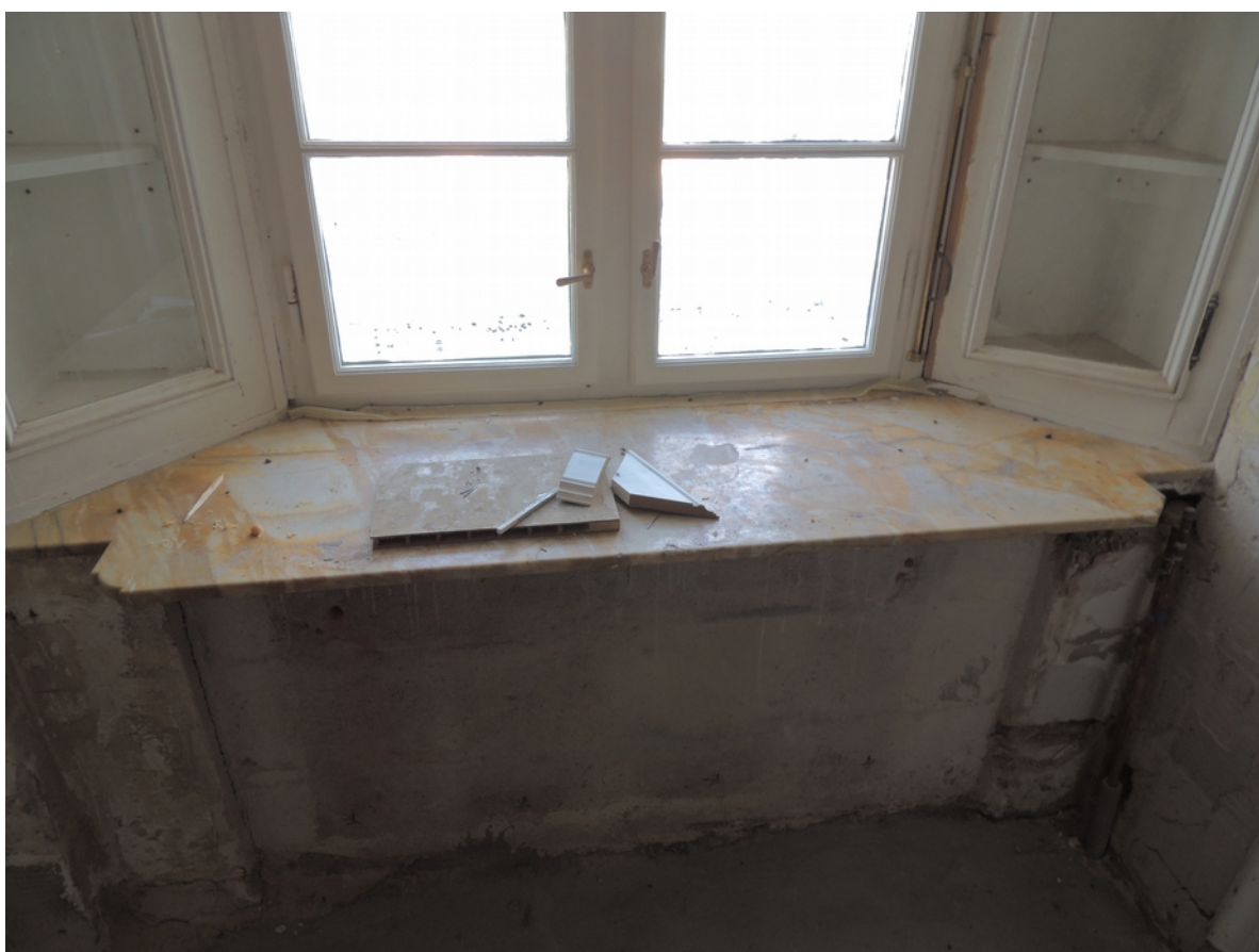
Panenské Břežany, horní zámek, koupelna v 1. patře, detail mramorového parapetu pod oknem – stávající stav