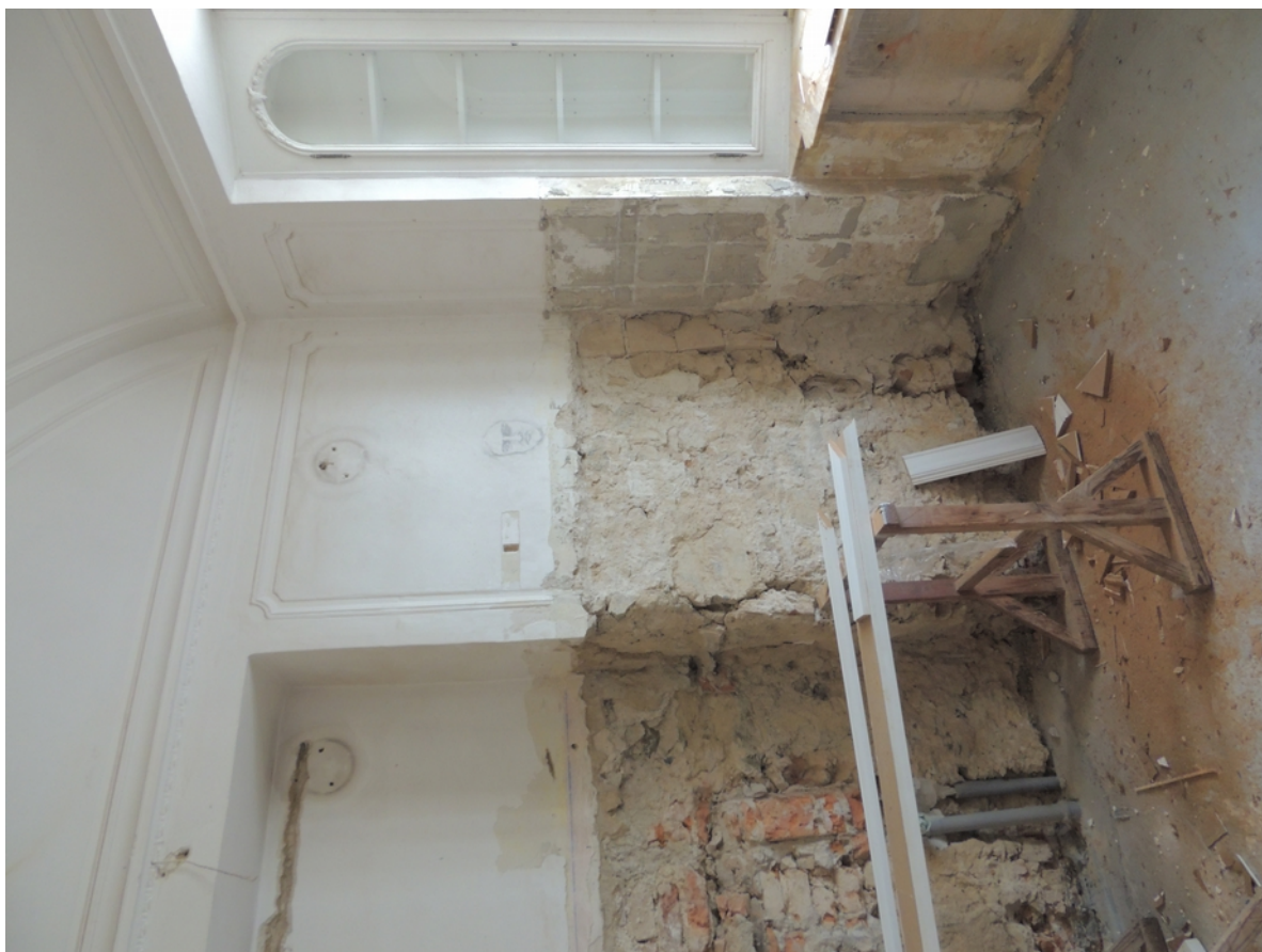
Panenské Břežany, horní zámek, koupelna v 1. patře, levá boční stěna, úsek u okna – stávající stav