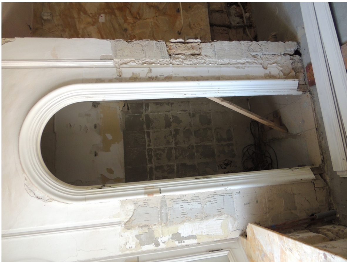
Panenské Břežany, horní zámek, koupelna v 1. patře, detail vstupu do toalety – stávající stav