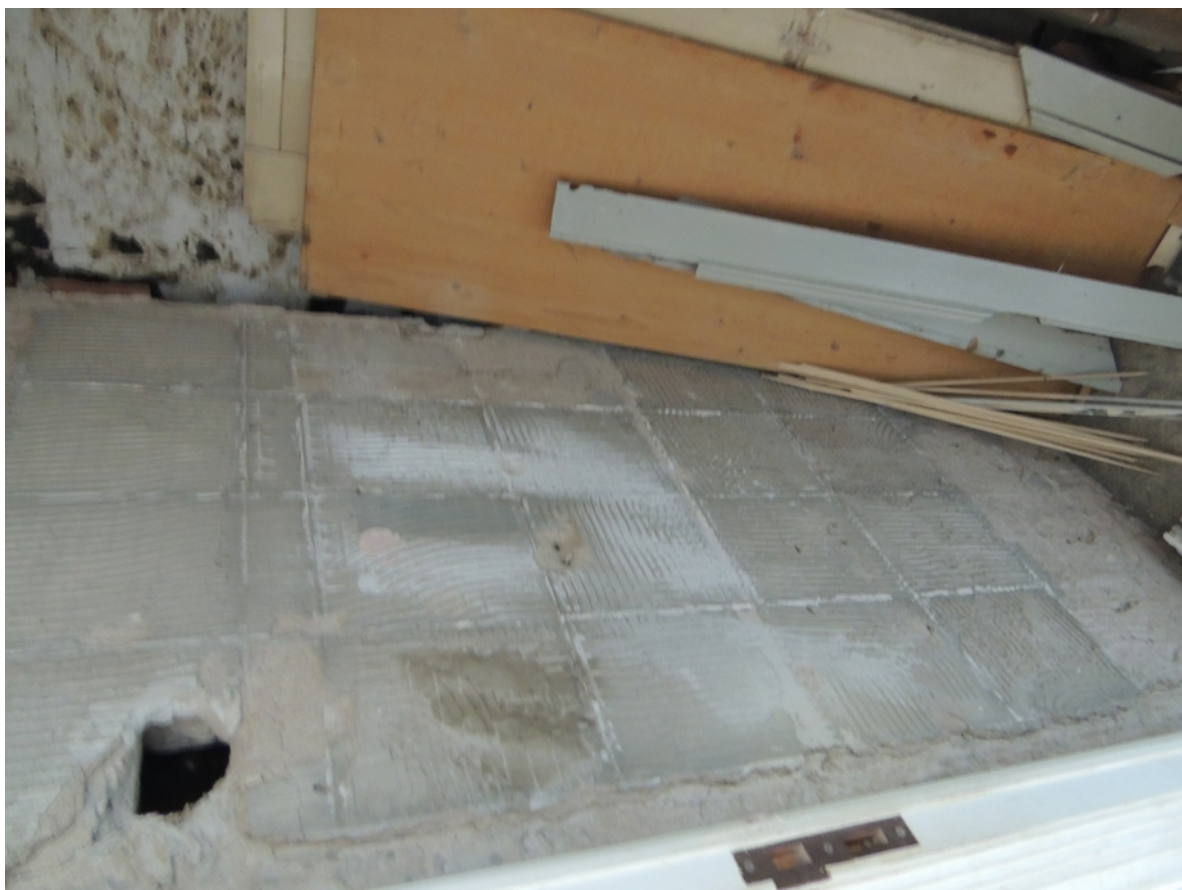
Panenské Břežany, horní zámek, koupelna v 1. patře, detail poškození omítek a sejmutých obkladů ve spojovacím meziprostoru – stávající stav