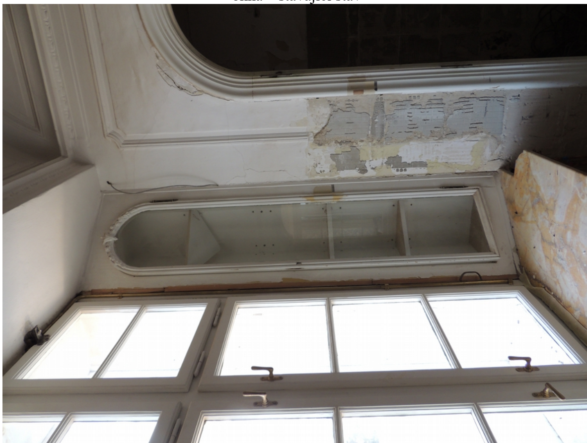
Panenské Břežany, horní zámek, koupelna v 1. patře, detail pravého úseku polic ve skosené špaletě okna – stávající stav