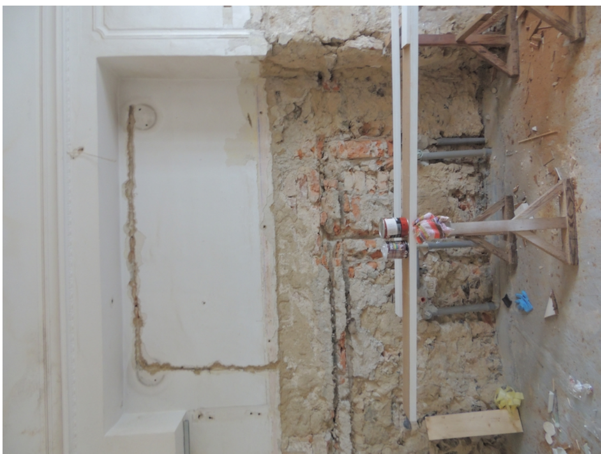
Panenské Břežany, horní zámek, koupelna v 1. patře, levá boční stěna, střední úsek s výklenkem pro dvojici umyvadel – stávající stav