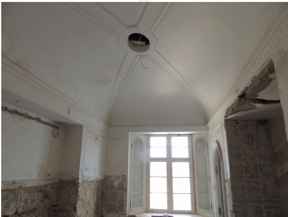
Panenské Břežany, horní zámek, koupelna v 1. patře, fabionový strop pohled k oknu – stávající stav