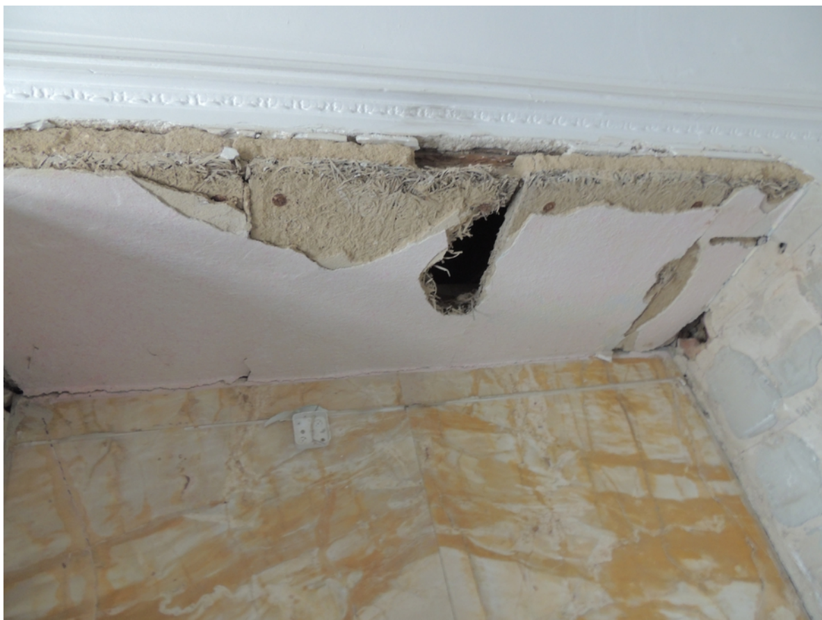
Panenské Břežany, horní zámek, koupelna v 1. patře, detail poškození nového podhledu ve výklenku pro vanu – stávající stav