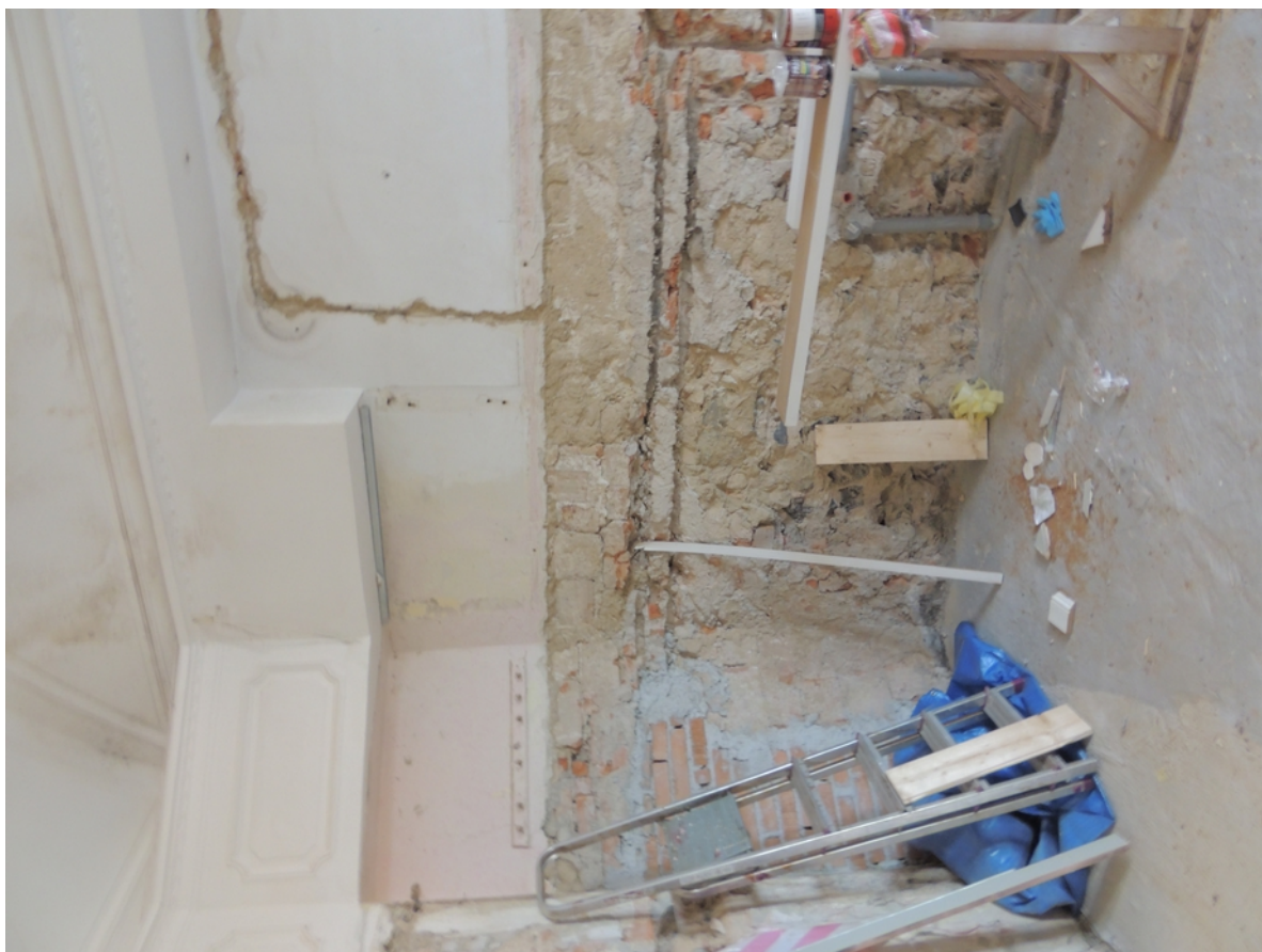
Panenské Břežany, horní zámek, koupelna v 1. patře, levá boční stěna, úsek u vstupu – stávající stav