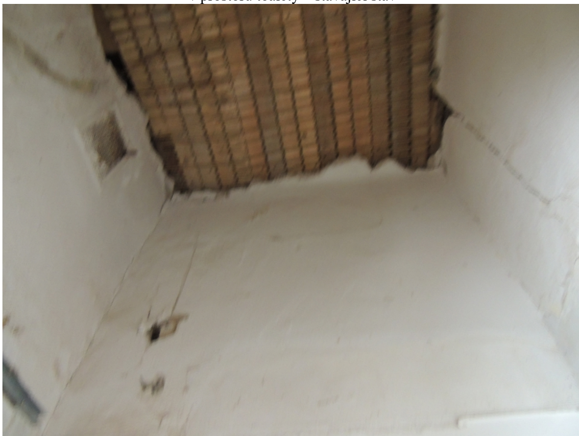
Panenské Břežany, horní zámek, koupelna v 1. patře, detail poškození omítek fabionového stropu v prostoru toalety – stávající stav