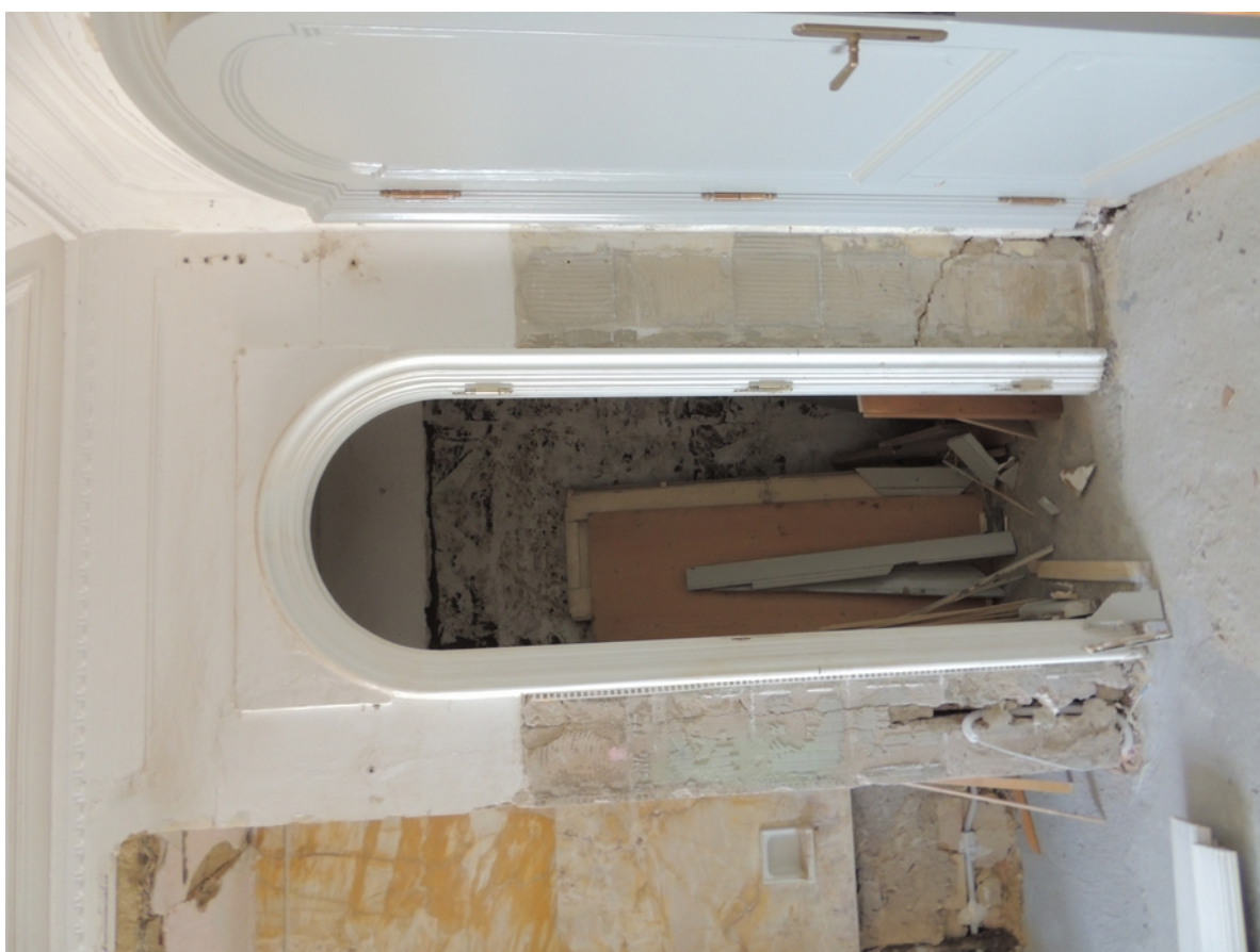
Panenské Břežany, horní zámek, koupelna v 1. patře, pravá boční stěna, úsek u vstupu se spojovacím meziprostorem – stávající stav