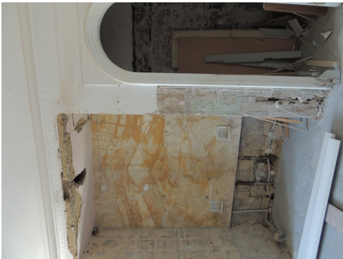
Panenské Břežany, horní zámek, koupelna v 1. patře, pravá boční stěna, úsek se spojovacím meziprostorem a výklenkem pro vanu – stávající stav