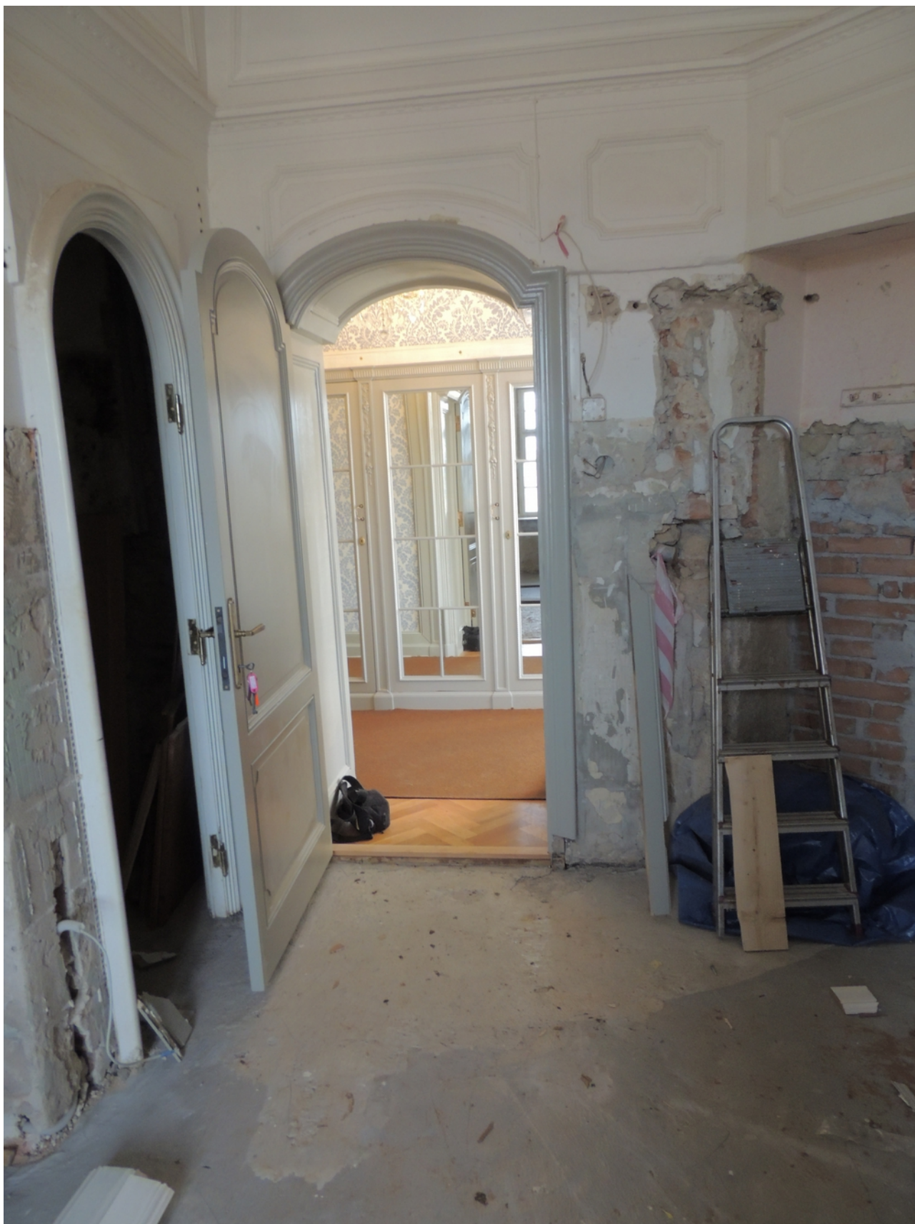
Panenské Břežany, horní zámek, koupelna v 1. patře (m. č. 2.08), pohled na vstupní stěnu – stávající stav