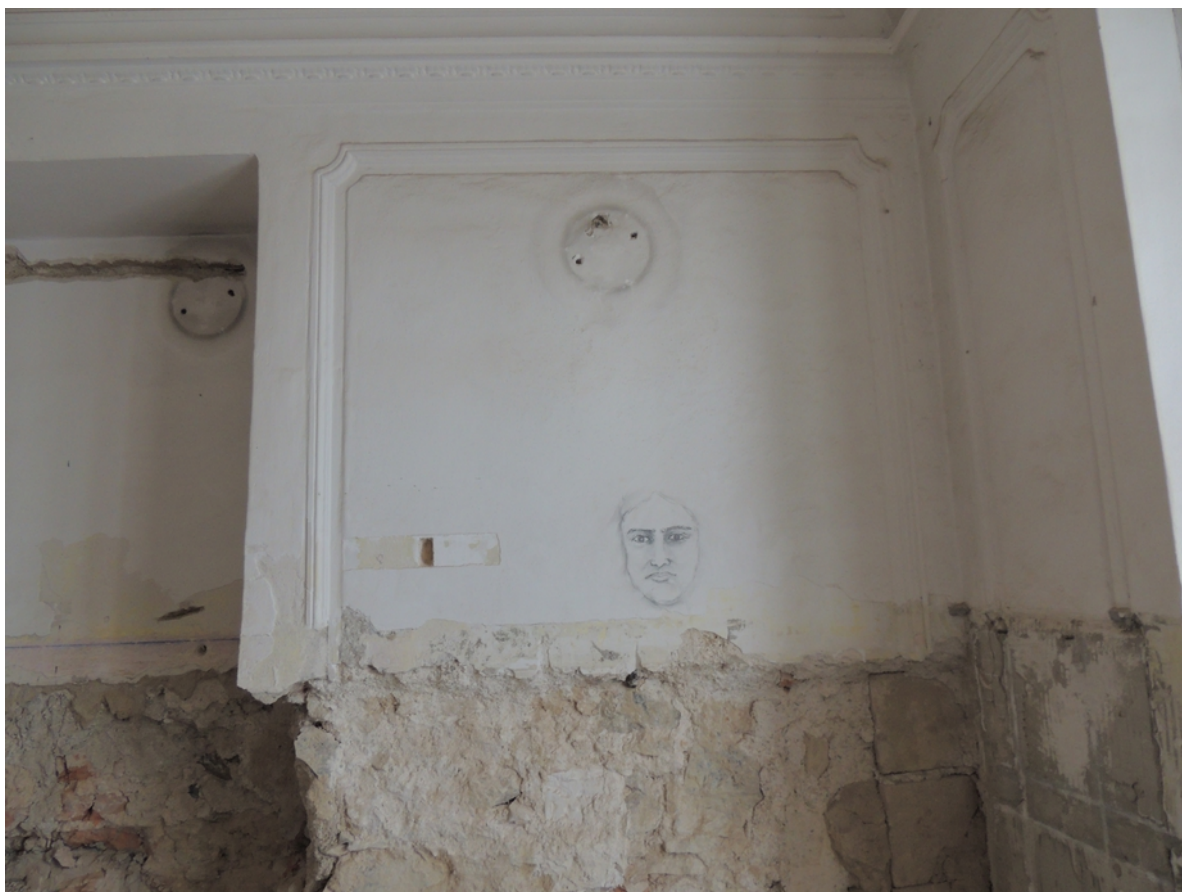
Panenské Břežany, horní zámek, koupelna v 1. patře, detail poškození štukové výzdoby na levé boční stěně – stávající stav