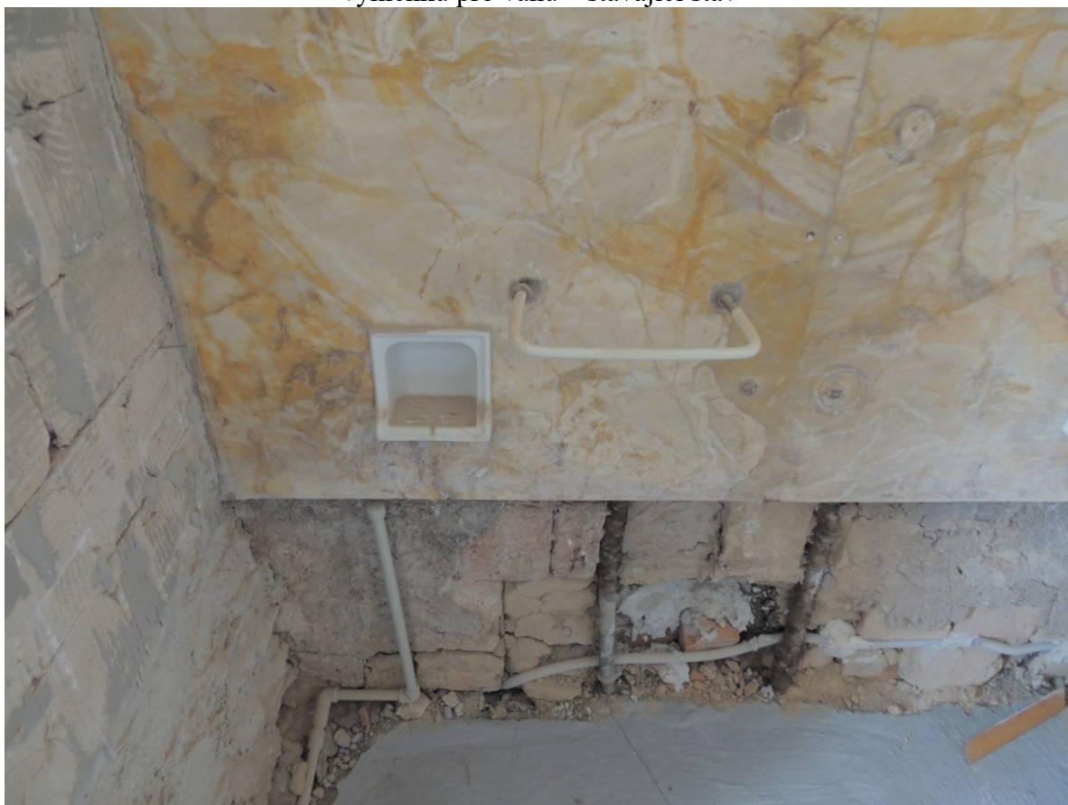
Panenské Břežany, horní zámek, koupelna v 1. patře, detail poškození kamenného obkladu výklenku pro vanu – stávající stav