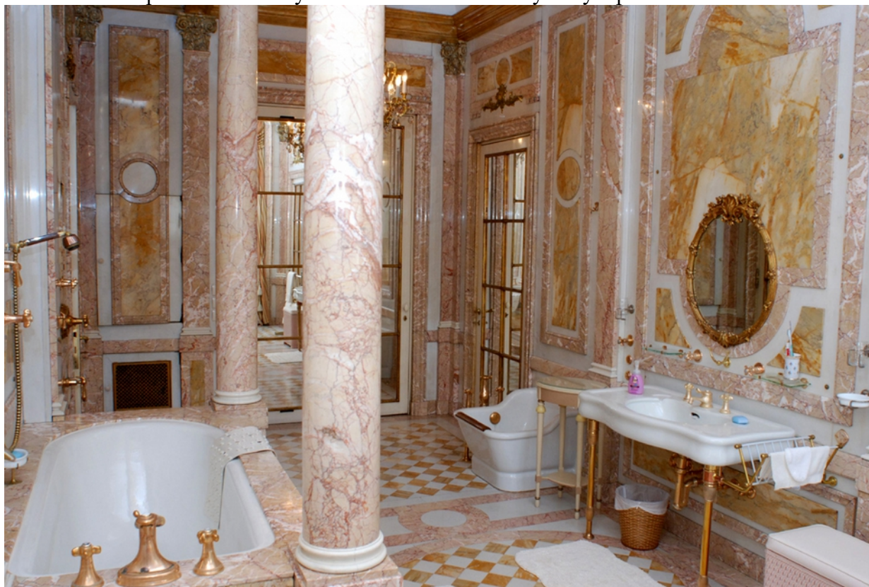
Praha- Bubeneč, Bubenečská 18, Petschkova vila (rezidence velvyslanectví USA), koupelna – stávající stav