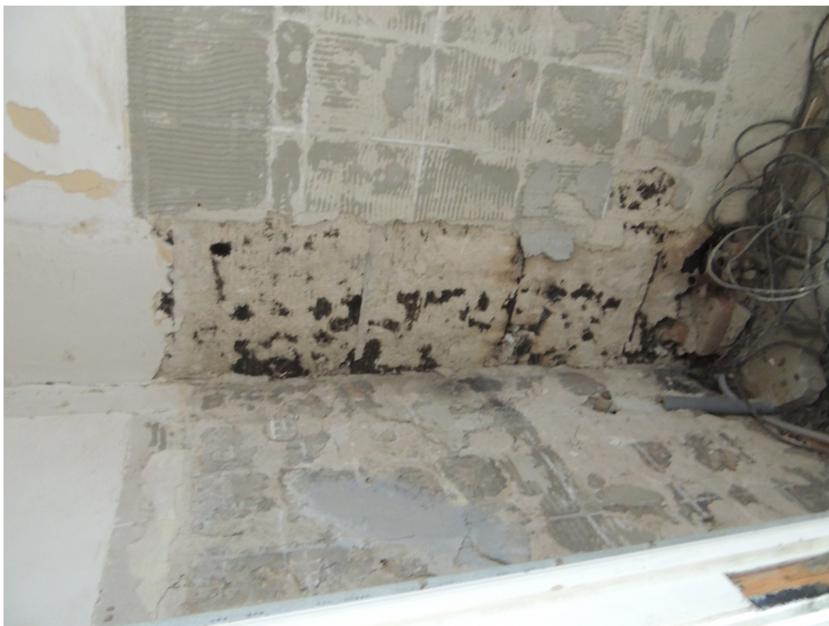
Panenské Břežany, horní zámek, koupelna v 1. patře, detail poškození omítek a sejmutých obkladů v prostoru toalety – stávající stav