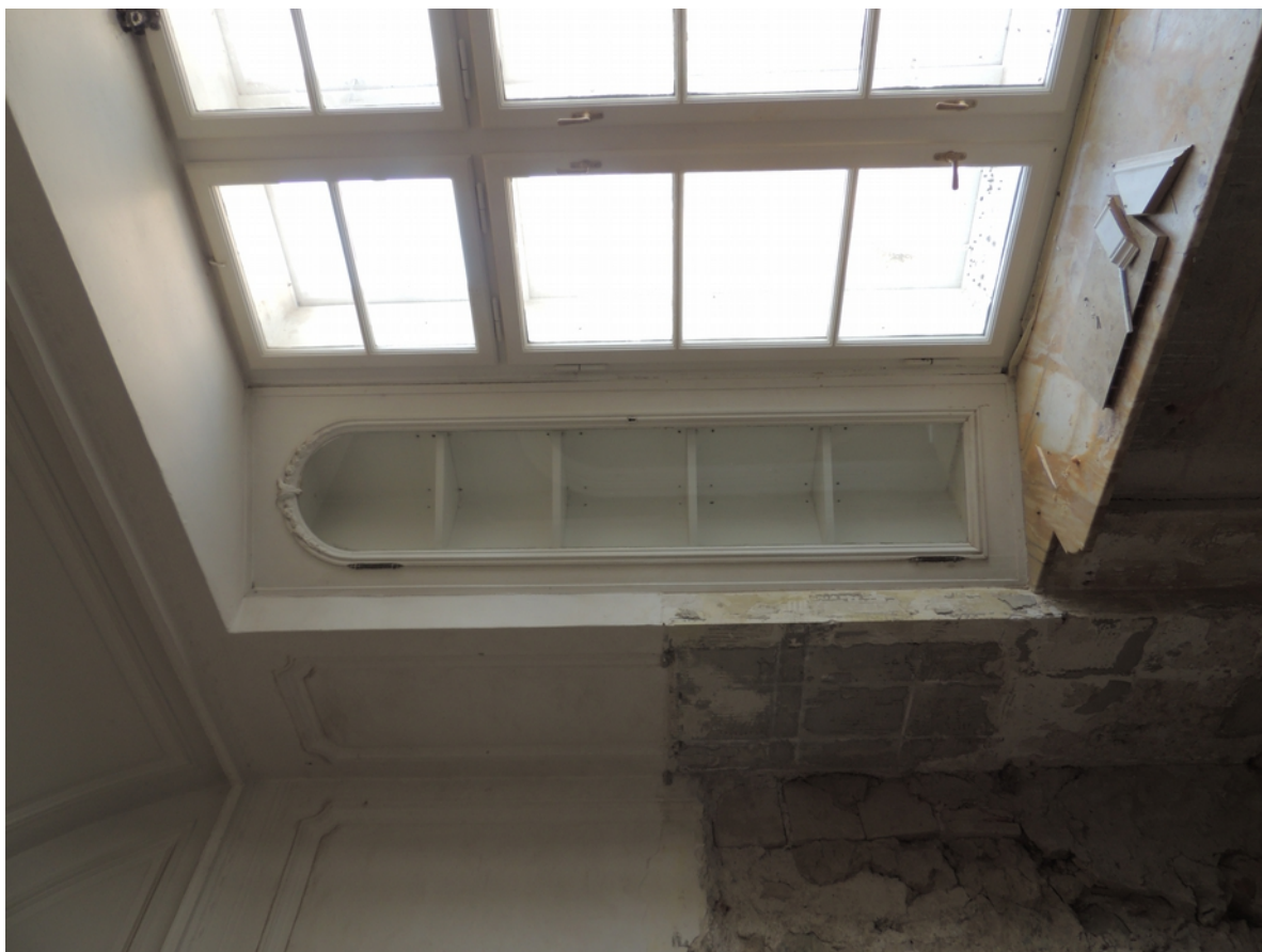
Panenské Břežany, horní zámek, koupelna v 1. patře, detail levého úseku polic ve skosené špaletě okna – stávající stav