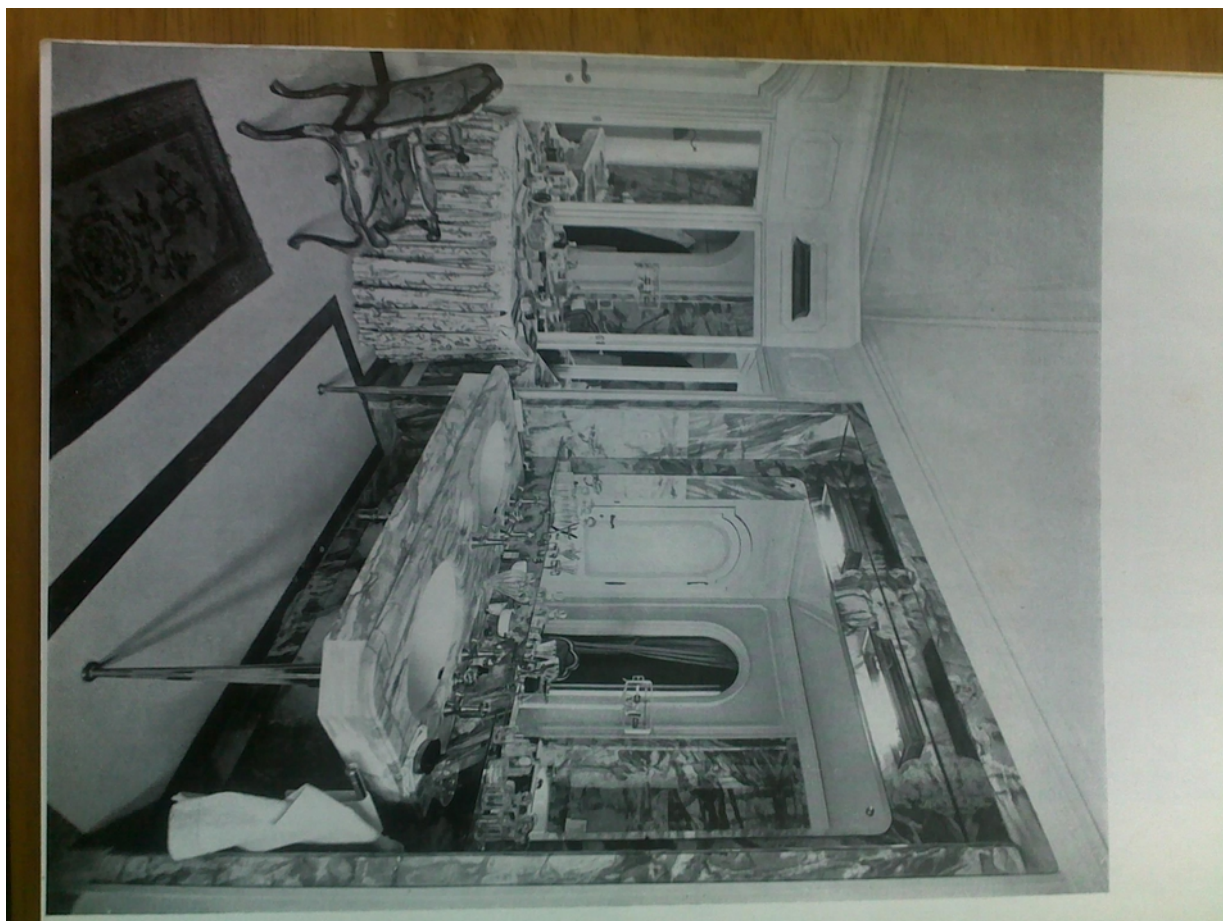
Panenské Břežany, horní zámek, koupelna v 1. patře (m. č. 2.08), pohled na levou boční stěnu a část pravé boční stěny v odraze zrcadla nad umyvadly – původní stav