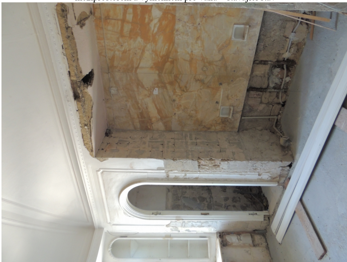
Panenské Břežany, horní zámek, koupelna v 1. patře, pravá boční stěna, úsek s výklenkem pro vanu a prostorem toalety – stávající stav