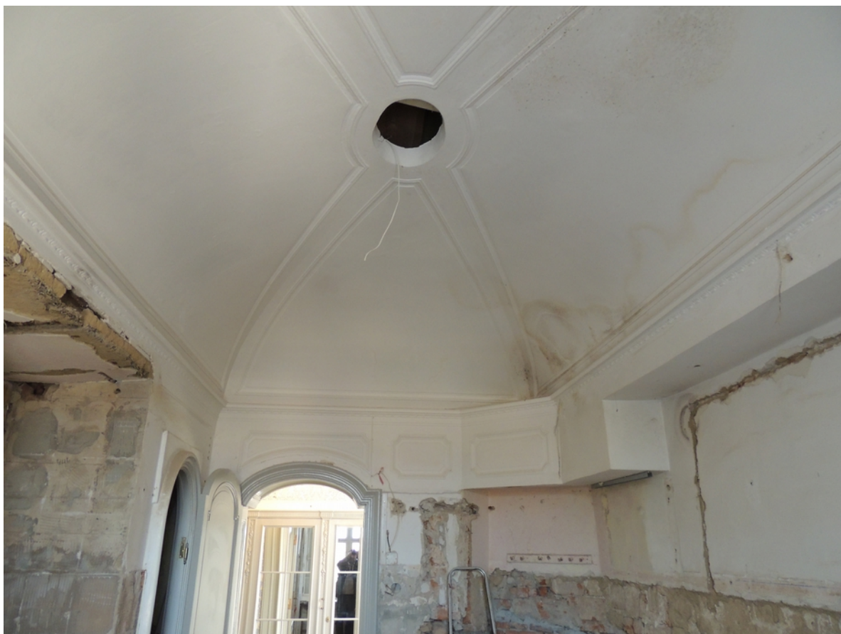
Panenské Břežany, horní zámek, koupelna v 1. patře, fabionový strop, pohled ke vstupu – stávající stav