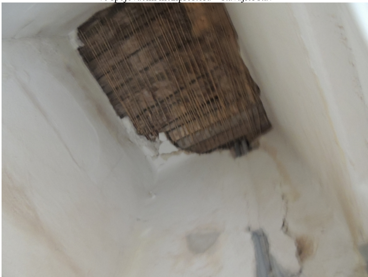
Panenské Břežany, horní zámek, koupelna v 1. patře, detail poškození omítek fabionového stropu ve spojovacím meziprostoru – stávající stav