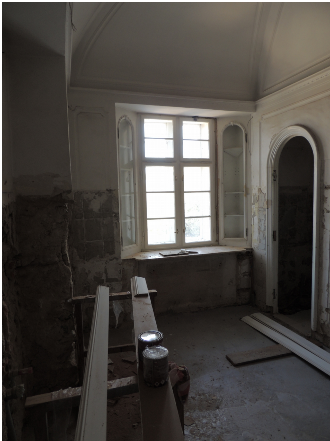
Panenské Břežany, horní zámek, koupelna v 1. patře (m. č. 2.08), pohled na stěnu proti vstupu s oknem – stávající stav