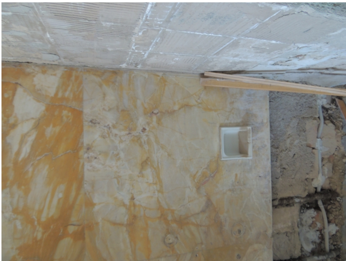
Panenské Břežany, horní zámek, koupelna v 1. patře, detail poškození kamenného obkladu výklenku pro vanu – stávající stav